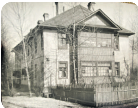
Старая Деревня, Липовая аллея, 15 А, корпус 1, 2 этаж, веранда